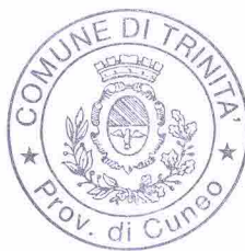
IL SINDACO Zucco Ernesta